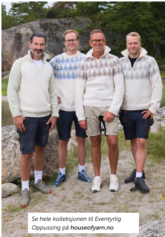
Se hele kolleksjonen til Eventyrlig Oppussing på houseofyarn.no